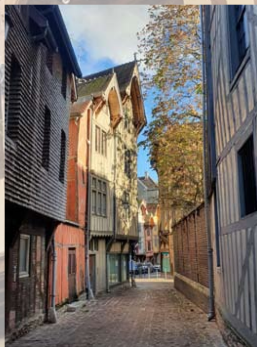
AR - Troyes La Champagne

* Choix donné entre andouillette de Troyes et un autre plat