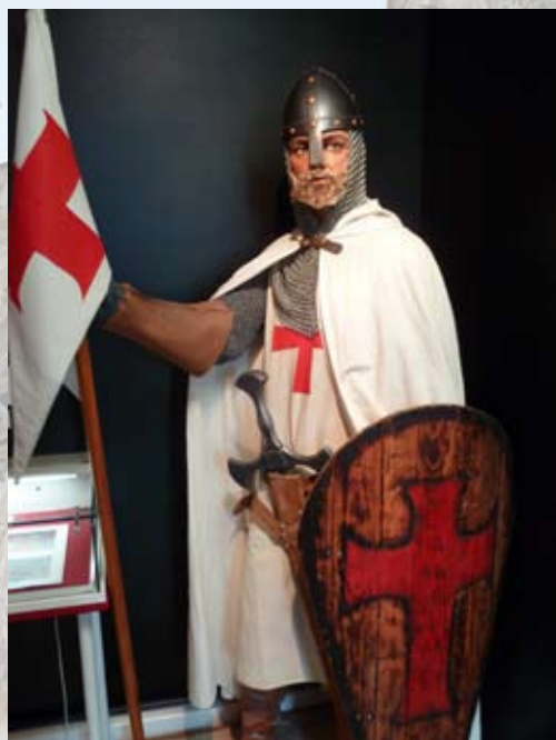
© Thierry Leroy - Musée des Templiers Hugues de Payns