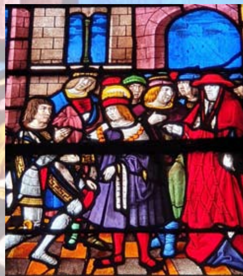
AR - Troyes La Champagne Tourisme