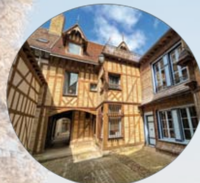
AR - Troyes La Champagne

15h00 / Balade commentée en bateau sur le lac d'Orient Mis en service en 1966, ce lac fait partie des 4 grands lacs de Champagne. Conçu dans le but de protéger Paris des inondations, ce lac artificiel de dérivation de la Seine de 23 km 2 est l'un des sites ornithologiques les plus riches de France et un haut lieu de villégiature des grands oiseaux migrateurs (grues cendrées, oies des moissons, cigognes noires...) (maximum 55 pers.)