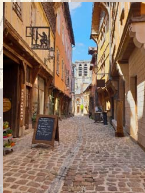
AL - Troyes La Champagne