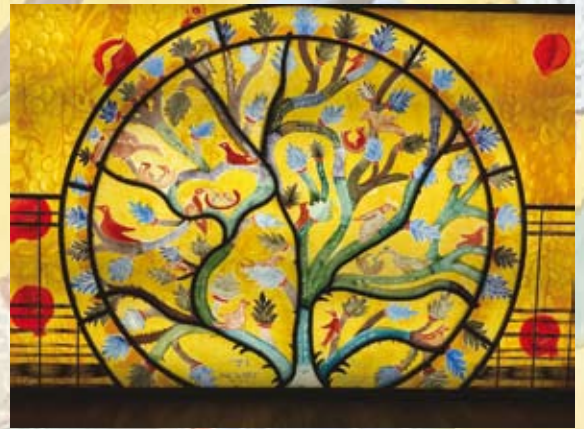
© NV - Troyes La Champagne Tourisme