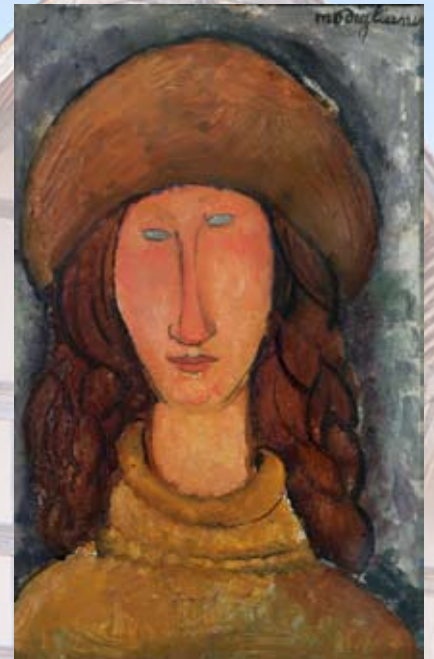
Amadeo Modigliani "Jeanne Hebuterne" 1918 Musée d'Art moderne, collections nationales Pierre et Denise Lévy

Musée des Beaux-arts (St Loup) où des chefs-d'œuvre de la peinture française du XIV e au XIX e s. (École de Barbizon, Mignard, Watteau...) y côtoient ceux de la peinture européenne (Spranger, Vasari, Rubens ou Bellotto). Dans le domaine de la sculpture, on peut y admirer des pièces médiévales rares provenant de la cathédrale ainsi que d'églises de Troyes et des environs ( fermé le mardi ).