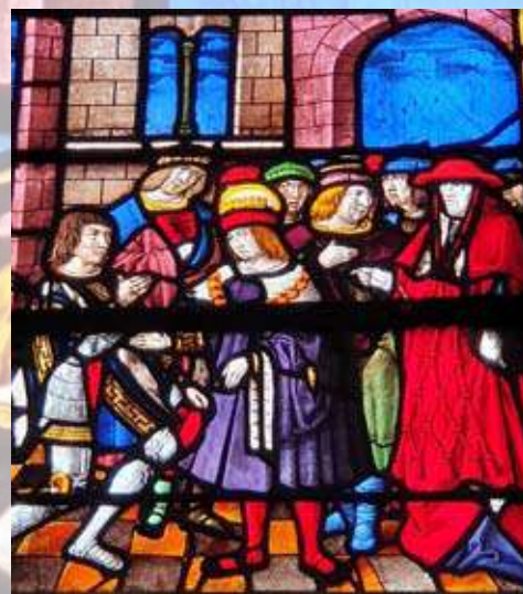
AR - Troyes La Champagne Tourisme