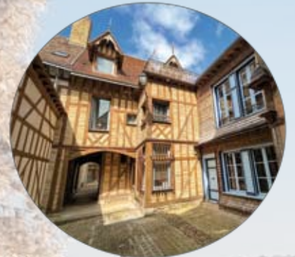
AR - Troyes La Champagne