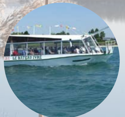
Le bateau ivre / Mesnil St Père