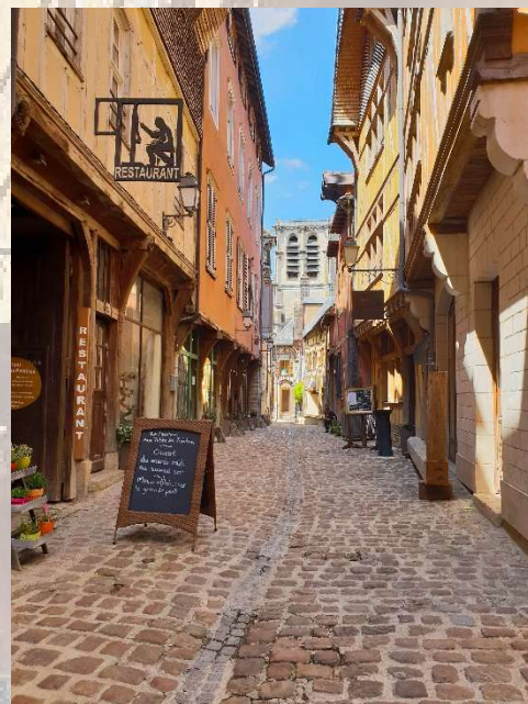
AL - Troyes La Champagne