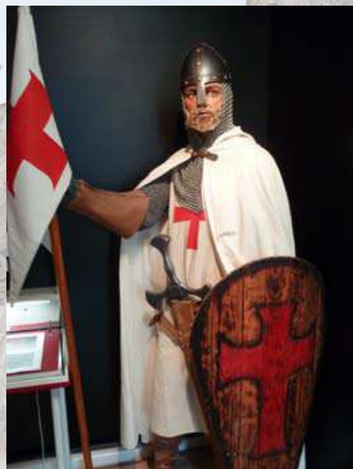
© Thierry Leroy - Musée des Templiers Hugues de Payns