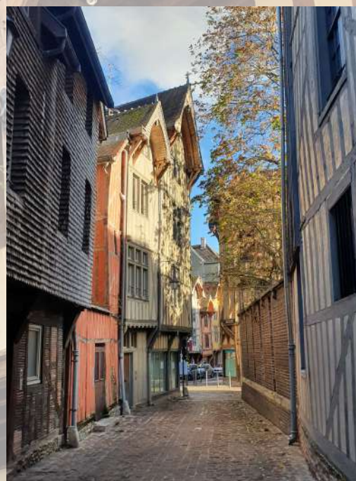
AR - Troyes La Champagne

* Choix donné entre andouillette de Troyes et autre plat